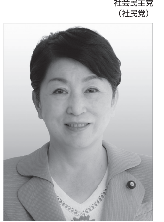
社民党党首 福島みずほ