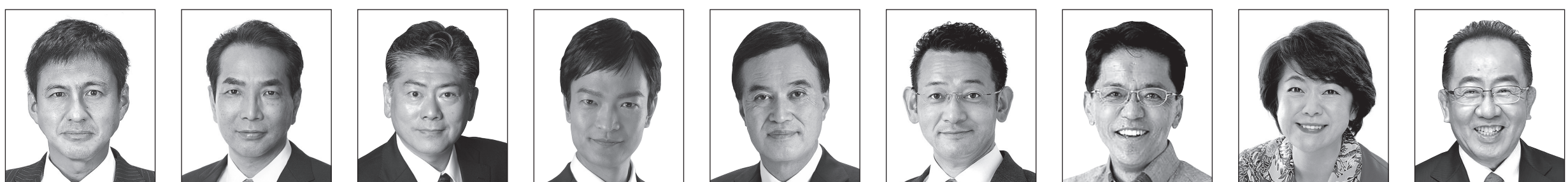
宮崎1区 たけい 俊輔 宮崎2区 江藤 拓 宮崎3区 ふるかわ よしひさ 鹿児島1区 みやし 拓馬 鹿児島3区 小里 やすひろ 沖縄1区 コクバ 幸之助 沖縄2区 ミヤザキ 政久 沖縄3区 島尻 あい子 沖縄4区 ニシメ 恒三郎

◎次の候補者は、小選挙区のみ立候補しております。福岡5区 原田よしあき 福岡8区 あそう太郎 福岡9区 みはら朝彦 福岡10区 山本幸三 長崎3区 谷川やいち 長崎4区 北村誠吾 熊本2区 野田たけし 大分2区 えとう征士郎 鹿児島2区 金子万寿夫 鹿児島4区 森山ひろし ※法令により、小選挙区のみ候補者は、本公報に顔写真の掲載ができません。