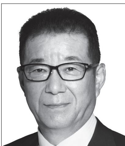
代表 松井 一郎