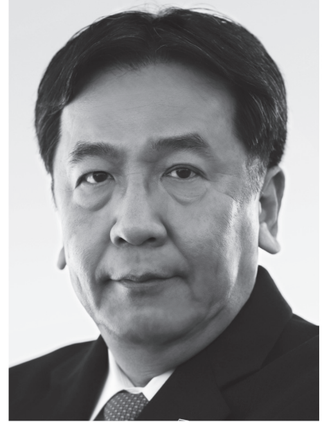
立憲民主党 代表 枝野幸男