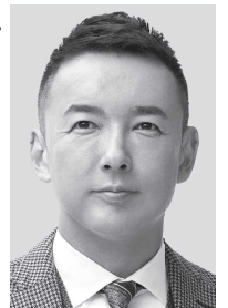
れいわ 新選組 (略称：れいわ) 代表 山本太郎