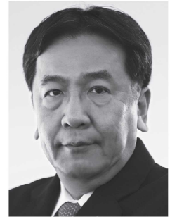
立憲民主党 代表 枝野幸男