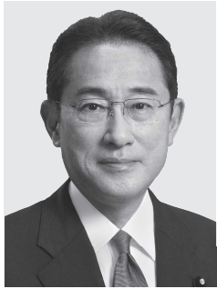
自由民主党総裁 岸田文雄