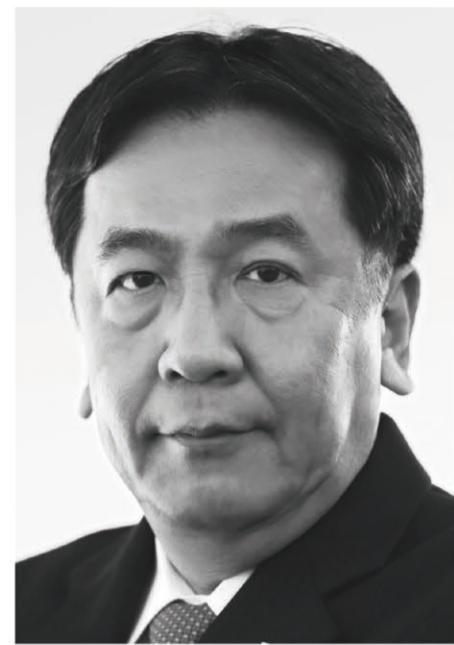
立憲民主党 代表 枝野幸男