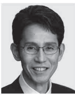
岩手1区 しなたけ し