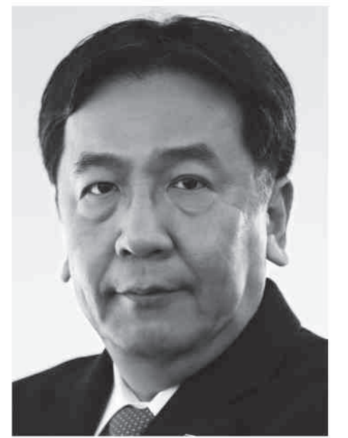
立憲民主党 代表 枝野幸男