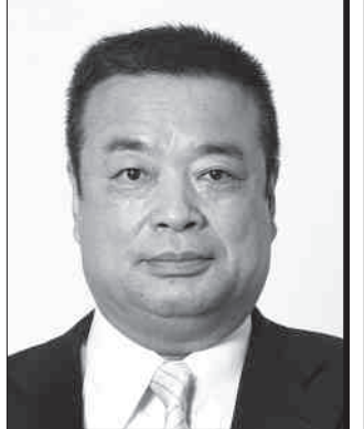
国民民主党 福島県総支部連合会代表