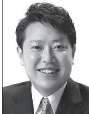
「加藤けんいちの思い」動画はこちら▶