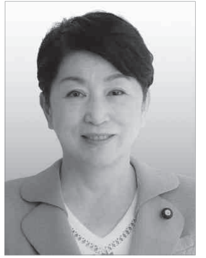
社民党党首 福島みずほ