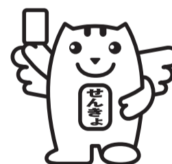
選挙の「めいすいくん」