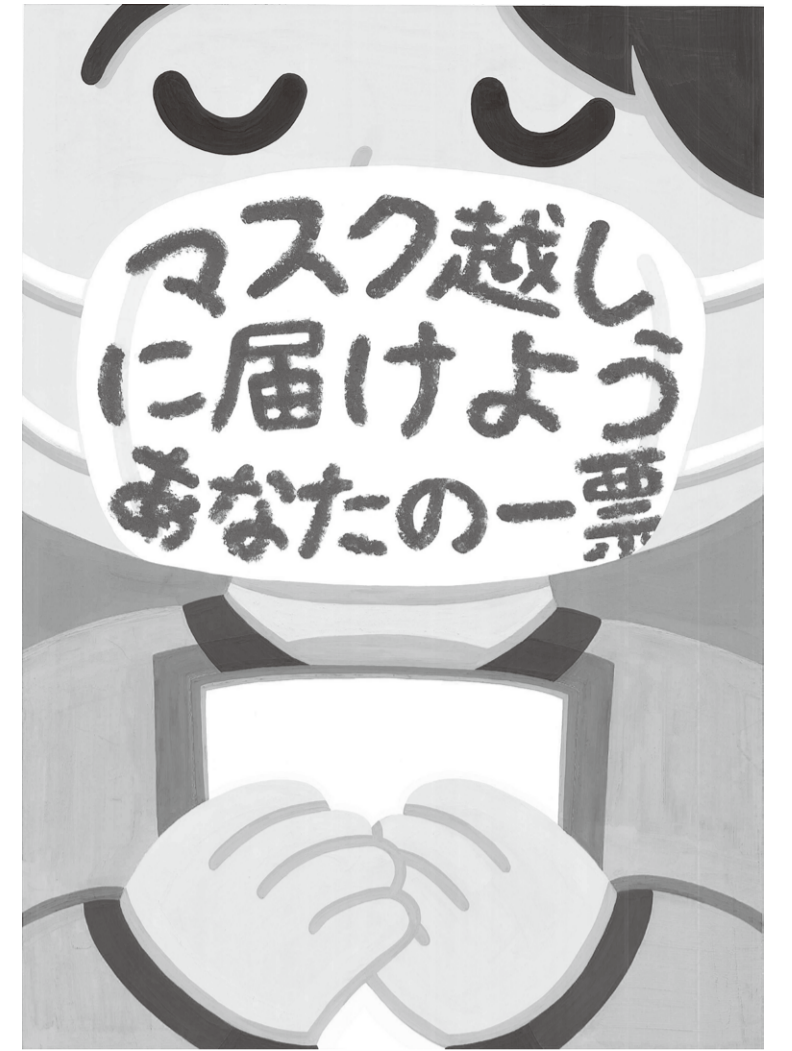
明るい選挙ポスターコンクール 香川県最優秀受賞作品 (三木ちさとさんの作品)

◎投票時間は午前7時から午後8時までです。(一部の投票所では、この時間が変更されていますからご注意ください。)