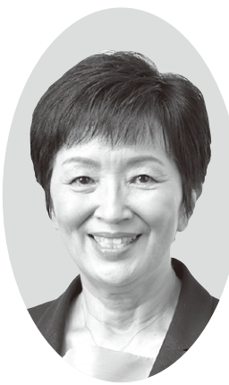
日本維新の会公認候補