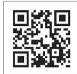
古川元久ホームページ