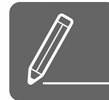
持参した鉛筆の 使用が可能