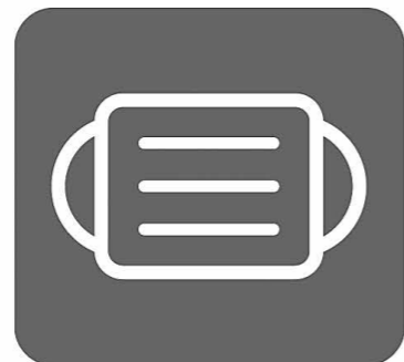
マスク着用 (咳エチケット)