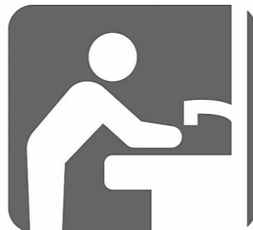
来場前後の手洗い