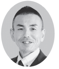
幸福実現党 こふうみじつげんとう