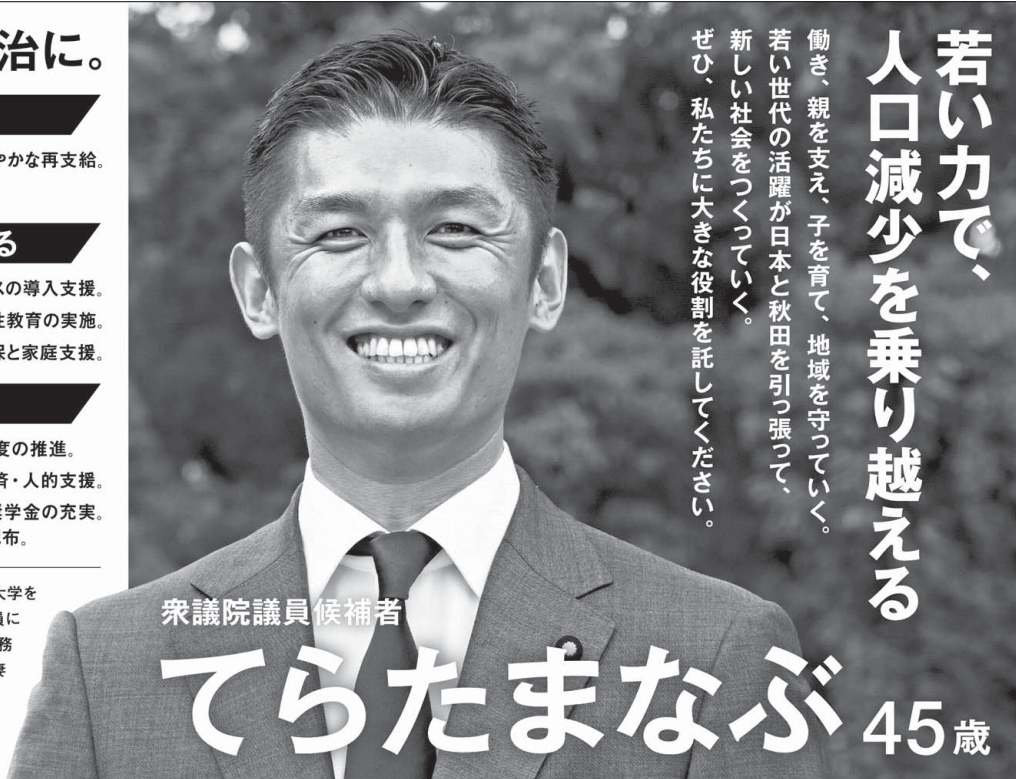
衆議院議員候補者

プロフィール / 横手市生まれ。横手高校、中央大学を卒業後、三菱商事に入社。2003年、衆議院議員に初当選(通算5期)。総理大臣補佐官、外務、財務金融委員会筆頭理事を歴任。小学生の息子と妻の3人家族。秋田港の日本海側拠点港湾指定からイージス・アショアの配備阻止まで、秋田と日本の為に努力して参りました。