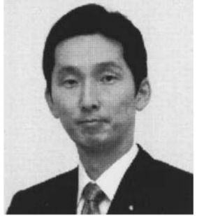
前衆議院議員 真山祐一 まやま ゆういち