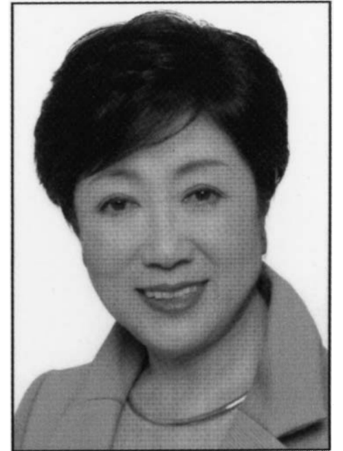
希望の党 代表 こいけ ゆりこ 小池 百合子