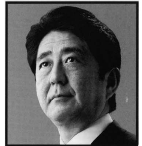
自由民主党総裁 安倍晋三