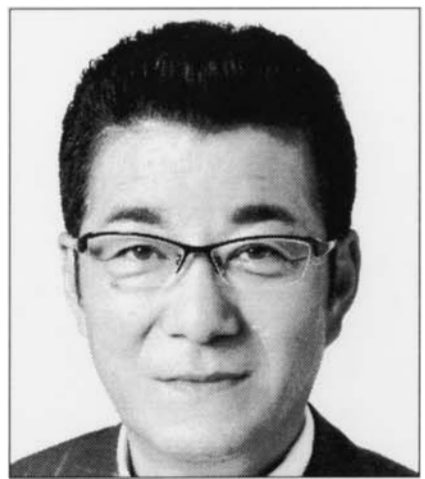
代表 松井 一郎