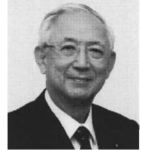
前衆議院議員 公明党幹事長 井上義久 いのうえよしひさ