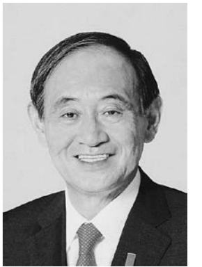
自民党公認 神奈川2区 すが よしひで 義偉

国民の安全・安心を守り抜く 政権発足以来、安倍総理と二三人脚で岩盤規制を打ち破り、この国を前に進めてきました。このように内閣官房長官の職務に専念できるのも、私を信じ、国政に送り続けていただいた皆様のおかげです。必ずやご期待にお応えし、魅力と活力にあふれる日本を創ってまいります。最優先で取り組んできた経済は、アベノミクスにより景気が着実に回復し、雇用は大幅に増加しています。弱い立場の人にはしっかりと手を差し伸べて、誰もが安心して暮らせる地域づくりに取り組みます。戦後最大の脅威とも言える北朝鮮の核・ミサイルから、日米同盟を基軸に断固として国民の安全・安心を守り抜きます。