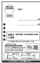
端の部分をめくって開きます

はがき1通で2人分の入場券になっています。はがきは圧着式です。 開いて中をよく読んでから、入場券を切り離して投票所へご持参ください。