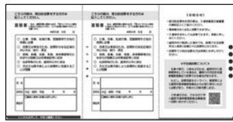
開いた中に説明が書いてあります