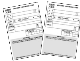
入場券を切り離して、投票所へご持参ください