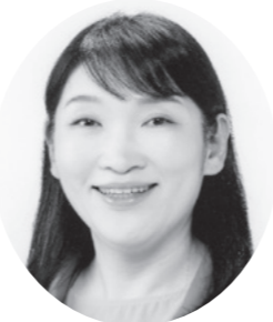
立憲民主党公認 新人