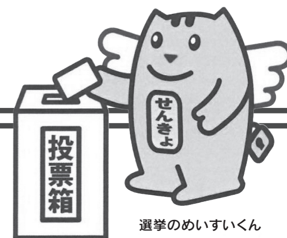
選挙のめいすいくん