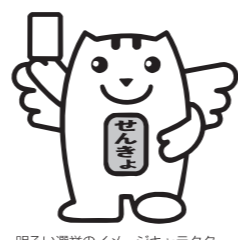
明るい選挙のイメージキャラクター「選挙のめいずいくん」