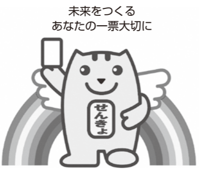
▲明るい選挙のイメージキャラクター「選挙のめいすいくん」

ちようふの みらいを、 市民の力で育てよう! 年齢・性別・障がいの有無を問わず安心安全に過ごせる街づくり。 市民の未来を若者に託すための、市議会議員の定年制導入。 子育て特区、調布へ。 市民の想いが届く市政に。 ウィズコロナからアフターコロナに向けて