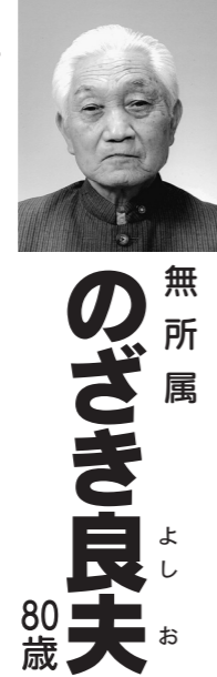
無所属 むろき よしお 80歳