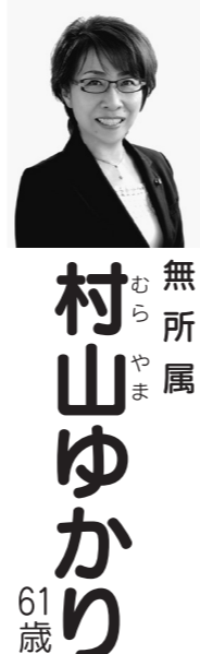
無所属 村山 ゆかり 61歳