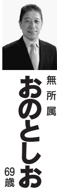
無所属 おの しろ 69歳