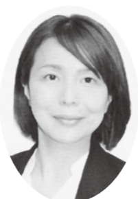
さいこう さいこういこ