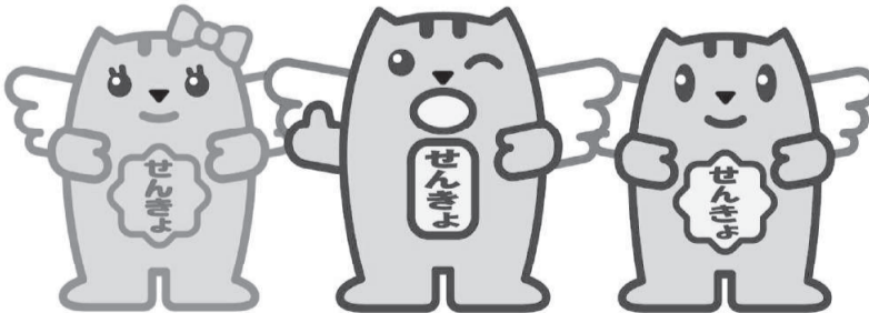
贈らない。 求めない。 受取らない。