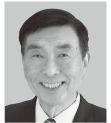
自由民主党公認候補