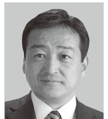
香川県議会議員候補

コロナ禍の中、原油価格・物価高騰なども重なり、厳しい経営状況にある県内産業への支援を継続するとともに、県民の声に耳を傾け、丸亀の地場産業をはじめとする地域経済の活性化に効果的な支援ができるよう取り組みます。