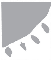
まえを向いて。 明るい選挙のシンボルマークです