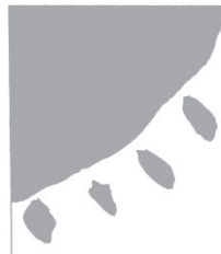
まえを向いて。 明るい選挙のシンボルマークです