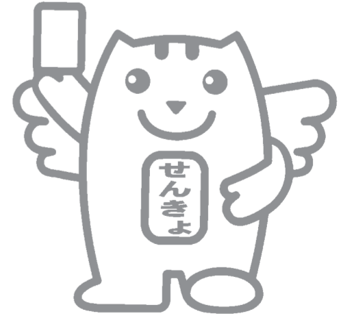
明るい選挙キャラクター 選挙のめいすいくん