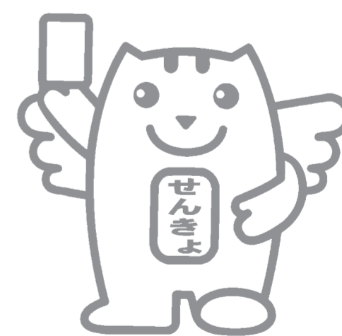
明るい選挙キャラクター 選挙のめいすいくん