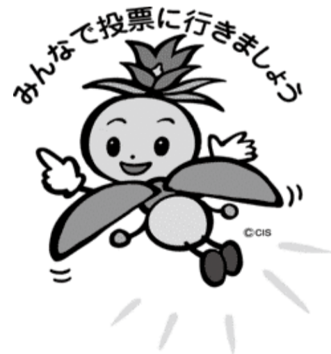
長野県選挙啓発マスコットキャラクター ほたりちゃん