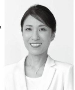
小諸市議会議員候補者