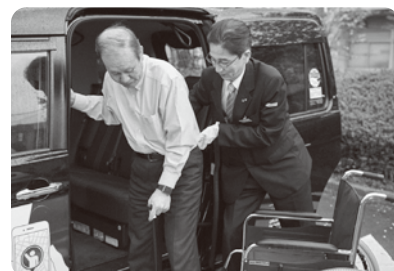
マイナンバーカード活用の タクシー運賃補助「マイタク」で 高齢者外出支援