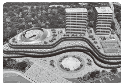
豊見城総合公園大改造計画 森の風テラス (イメージ)

豊見城村立長嶺小・中学校卒業(17期生) 沖縄県立小嶺高等学校卒業(35期生) 平成22年 株式会社 那覇バス入社・退社 平成23年 豊見城市議会議員初当選(29歳) 令和4年8月末 辞職 市議会議員3期12年 【活動】保和会会派長・議会運営委員会委員長・ 自民党青年局部長・保護司(那覇保護区)・薬物乱 用防止協会南部支部会員・平成26年~平成28年 よみ小学校PTA副会長 【家族構成】妻・子(3男1女)