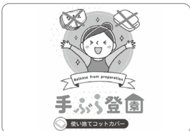
保育園サブスクで手軽に登園! おむつやお拭きが 定額使い放題