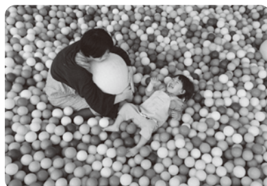
お天気に左右されず 思い切り遊べる室内型公園 (イメージ)