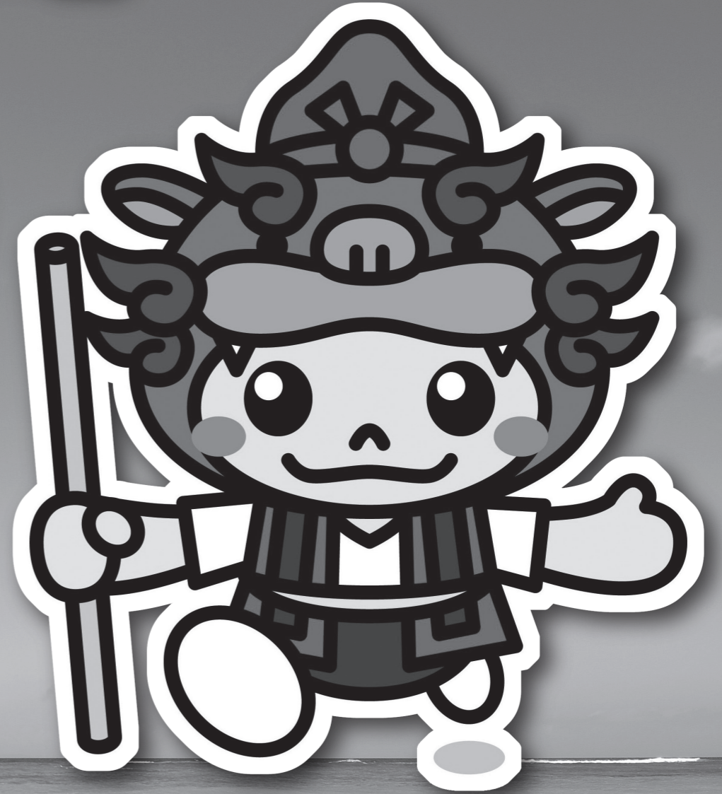
やえせのシーちゃん