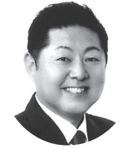
つねよし 太吾 だいで