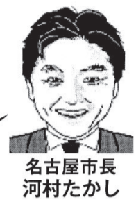
名古屋市長 河村たかし