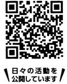
日々の活動を公開しています!

長寿社会に対応した支援策の充実を目指します。保育園や幼稚園の充実と子育て支援への取り組みを進めます。