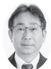
ひきろし ひきろし