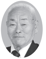
栗原市議会議員候補者