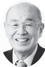
栗原市議会議員候補者