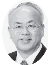
菅原 ゆうき 日本共産党