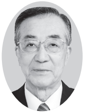
栗原市議会議員候補者

元 栗駒町議会議員 元 栗つこ農業協同組合理事 栗原市議会議員(元建設常任委員会委員長) 栗原市議会副議長 栗原市議会議長