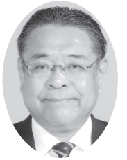
市議会議員候補者

昭和60年 衆議院議員秘書 平成11年 築館町議会議員(2期) 平成21年 栗原市議会議員(3期) 平成25年 栗原市議会議長(第6代) 議会運営委員会委員 産業建設常任委員会 都市計画審議委員会委員 共同通信社さくらぎ会会員