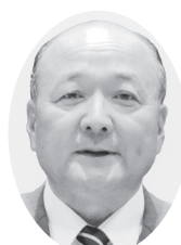
おの 久一 日本共産党