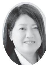
栗原市議会議員候補者