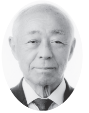
栗原市議会議員候補者

築館高等学校卒業 一 迫町生涯学習課長 同 税務課長 同 町民福祉課長(兼)保育所長 一 迫町連合青年団長 栗原市子ども会育成連合会長(3期) 一 迫地区子ども会育成親の会連合会長(9期) 栗原市監査委員 (議会選出、現在通算8年目)