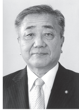
山田 じ 日本共産党 みちかず