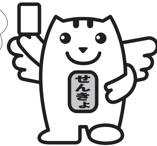
明るい選挙のイメージキャラクター 選挙のめいすいくん