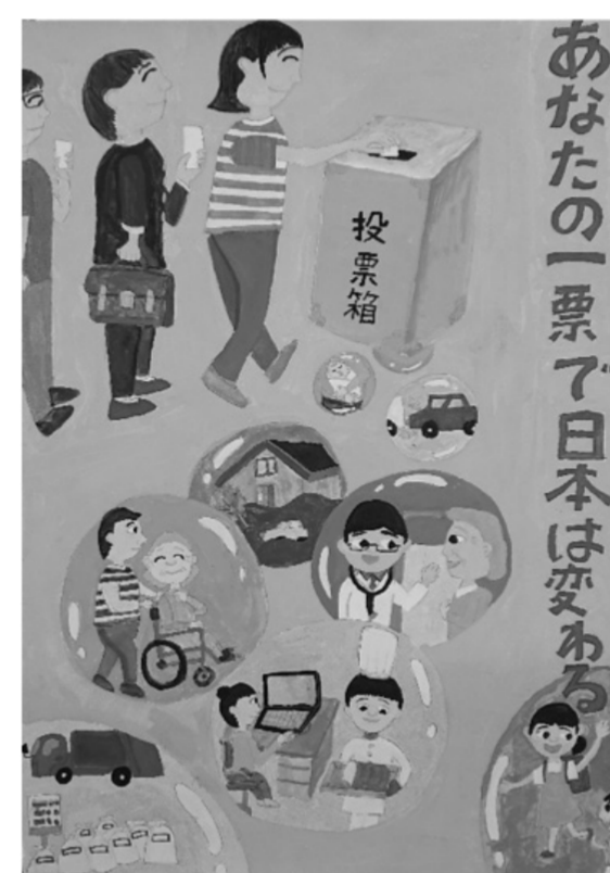
令和2年度 明るい選挙啓発ポスターコンクール 特選作品