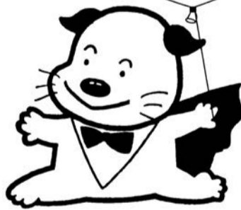
明るい選挙推進シンボルキャラクター「ホープくん」