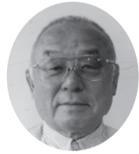
日本共産党 えんどう 遠藤たしゆき (六十七歳)