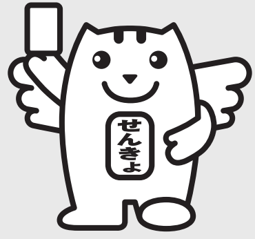
「選挙のめいすいくん」