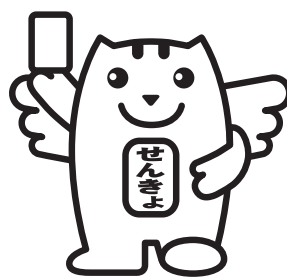
選挙の「めいすいくん」

※選挙公報の掲載順は、くじによって決められたものです。立候補の届出順とは異なる場合があります。