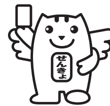
選挙の「めいすいくん」

※選挙公報の掲載順は、くじによって決められたものです。立候補の届出順とは異なる場合があります。