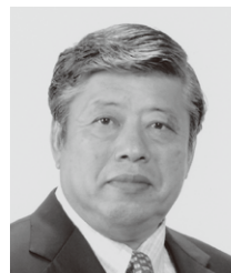
自由民主党公認候補