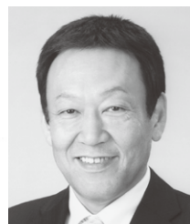
自由民主党公認候補

今の行政は、病の根本を完治できない間違った治療をしています。 香川創生へと導くカギとなる、豊かな人づくりに焦点をあて、家族・教育・経済のリンクを正しく再生することで私たちの目指す社会づくりができるのです。