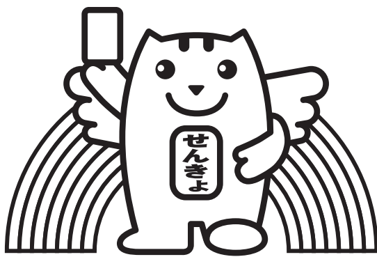
明るい選挙のイメージキャラクター 「選挙のめいすいくん」