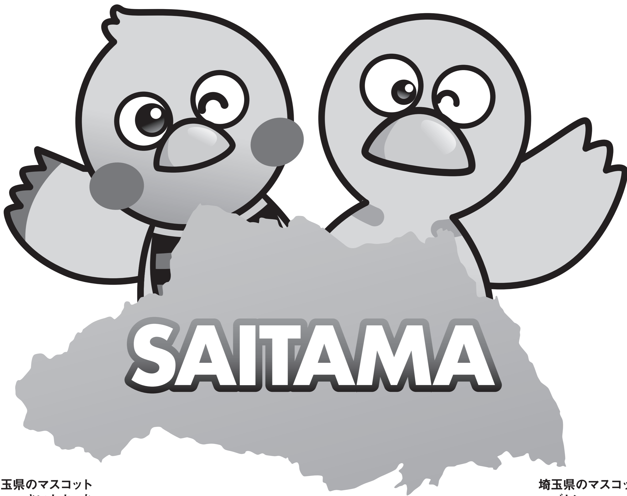
埼玉県のマスコット さいたまっち