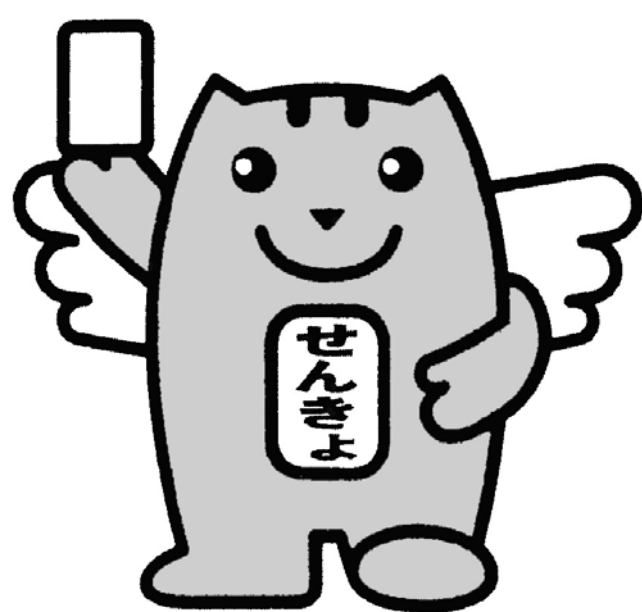
「選挙のめいすいくん」