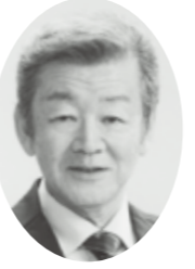
藤枝が大好きです！ えんどうつにお

市民の皆様への代弁者として議会質問も3期12年間で48回行いました。すべての市民の皆様が、笑顔で暮らせる藤枝市づくりを目指して頑張ります!! 1. 子育て支援に全力 2. 介護予防・認知症予防に全力 3. 安全安心な生活環境の整備に全力 4. 若い世代の方々が帰ってきたい町づくりに全力 4つの 全力 を実現します!! そのために、これまで携わってきた具体的な事業をさらに発展させます!! 放課後児童クラブの各小学校区への設置・市許可の19人以下の保育所設置 認定こども園の設置による保育待機児童の解消・給食アレルギーへの対応 各地急傾斜地崩落防止事業・志太中央幹線の早期開通 子供達・高齢者の皆様のための居場所づくり・介護保険料の軽減 藤枝定住を目指した首都圏大学生への奨学金制度の創設・鳥獣被害対策 高校生までの子供の医療費無料化・商店街の再活性化・各地区水道路改修等