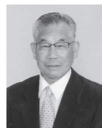
とよだ 豊田 かいよう 海洋