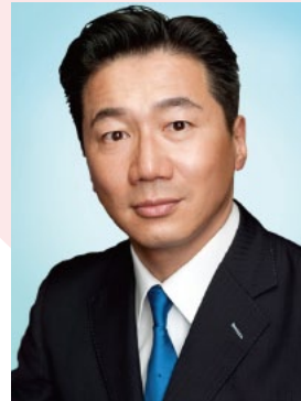
福山 哲郎 参議院議員・民主党

加えて、政治だけではなく世の中で起こっているあらゆる事に関心を持ち、 自分なりの意見を持って家族や周囲の人と積極的に対話する重要性も ご理解いただける企画をご用意しております。