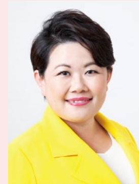
宮川 典子 衆議院議員・自由民主党

1995年京大大学院卒業後、大和證券株式会社入社。1990年(財)松下政経塾入塾(第11期生)。1998年参議院議員選挙に京都選挙区より立候補。翌年、民主党に入党。2004年参議院議員選挙当選。2009年党 政調会長代理就任。2010年内閣官房副長官に就任(菅直人内閣)。参議院議員選挙当選。内閣官房副長官に再任(菅改造内閣)。2011年内閣官房副長官に再任(菅・二次改造内閣)。参議院外交防衛委員長に就任。2014年民主党政策調査会長に就任。2015年民主党幹事長代理就任。