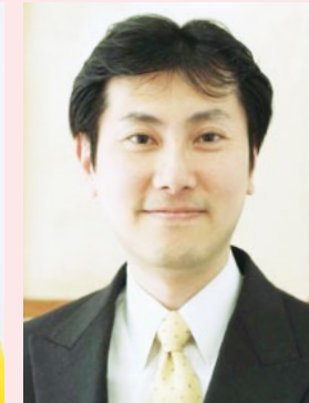
谷口 将紀 東京大学教授(政治学)

山梨県出身。昭和54年生まれ。慶應義塾大学卒業後、母校である山梨学院附属中学・高等学校の全学年で教鞭を執り2007年(財)松下政経塾入塾(第28期生)2010年第22回参議院議員通常選挙に出馬するも3,745票差で落選。2012年第46回衆議院議員総選挙にて初当選。県下で唯一小選挙区を制し県内初の女性衆議院議員へ。2014年第47回衆議院議員総選挙にて再選を果たし、現在2期目・自由民主党青年局青年副部長、自由民主党ネットメディア局長。