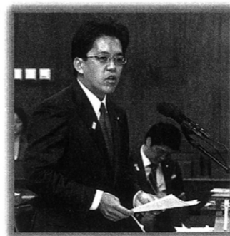
認可外保育施設への防音工事を実現しました