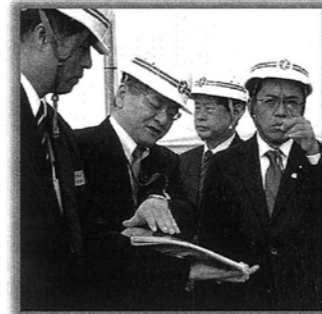
浦添市西海岸開発の現場を視察