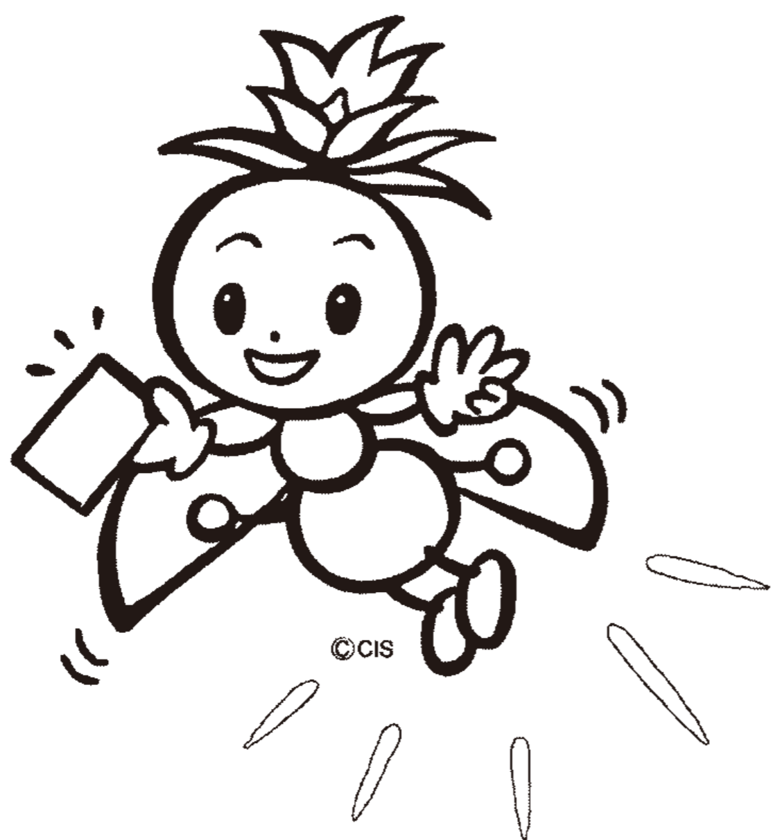
長野県選挙啓発マスコットキャラクター ほたりちゃん

仕事や旅行などの理由で、投票日当日に投票できない方は、 12月13日(土)まで期日前投票ができます