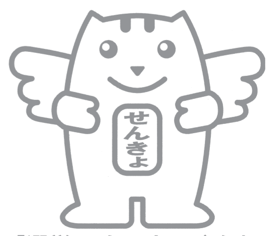
「選挙のめいすいくん」

※ 期日前投票は、市役所や町村役場などで行うことができます。詳しくは、各市町村の選挙管理委員会にお問い合わせください